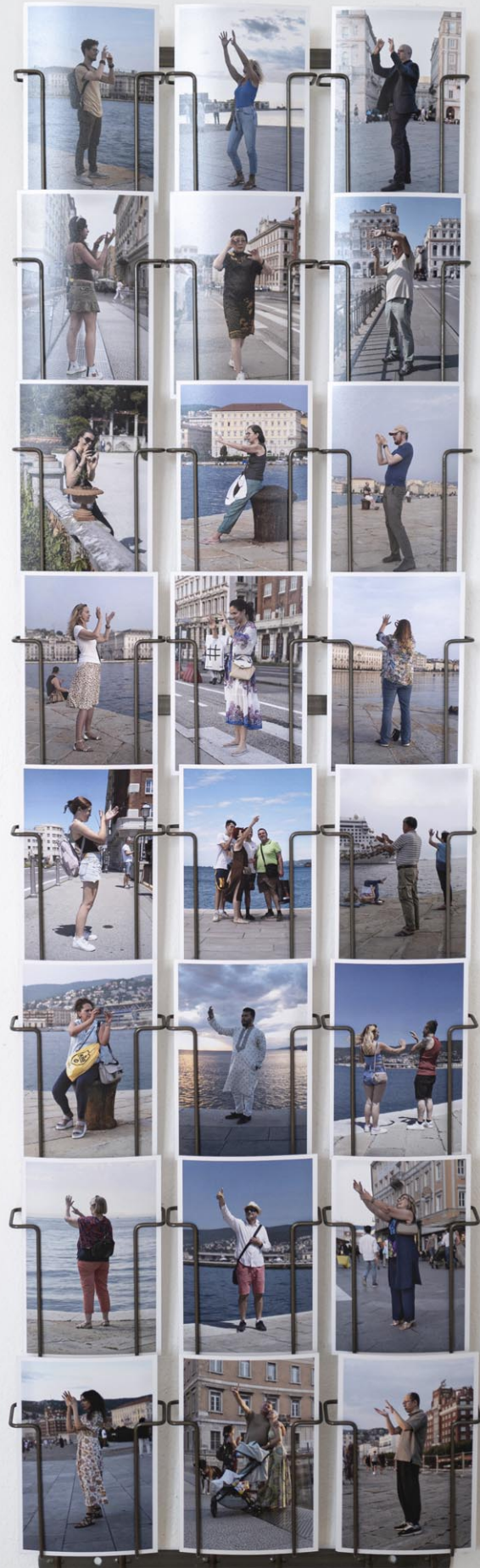
Picture postcard special edition in card holder